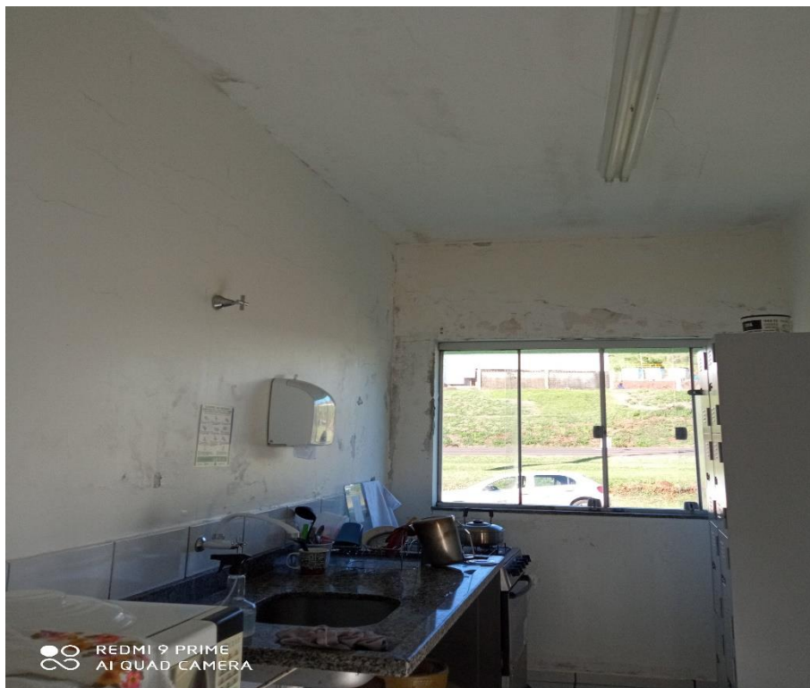
Figura 11 – Recuperação de laje e paredes;