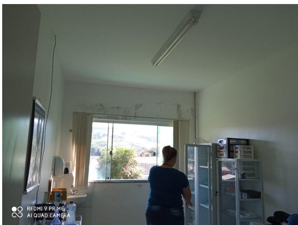
Figura 07 – Pintura interna;