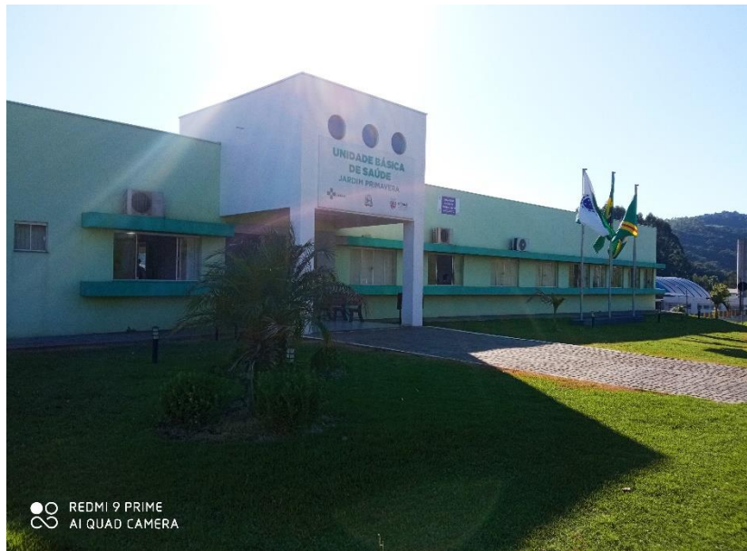
Figura 02 – Fachada da UBS;