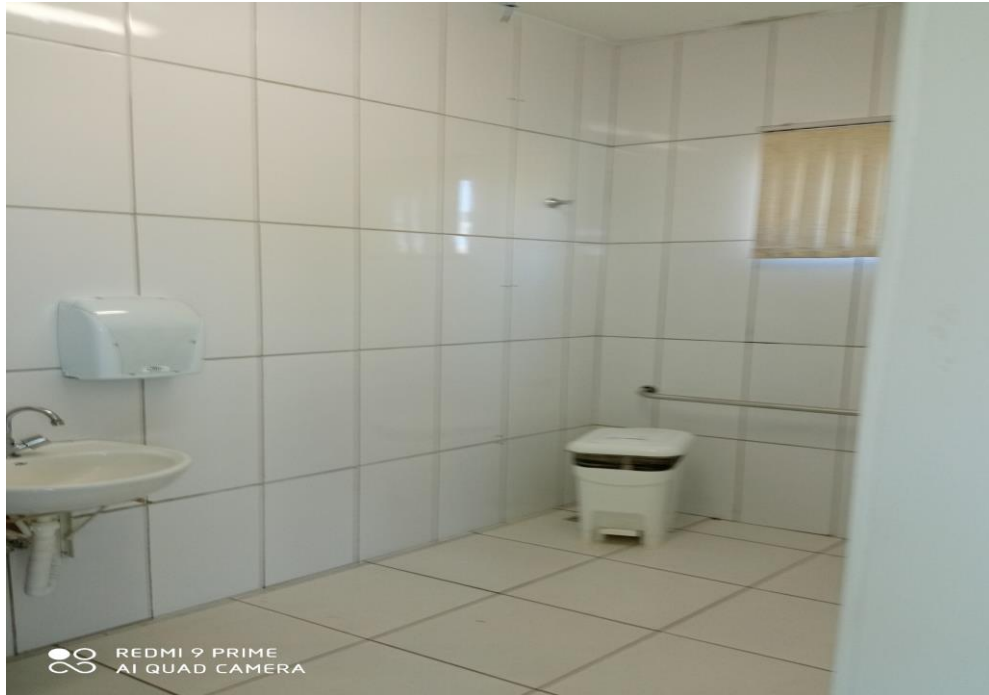
Figura 14 – pintura;