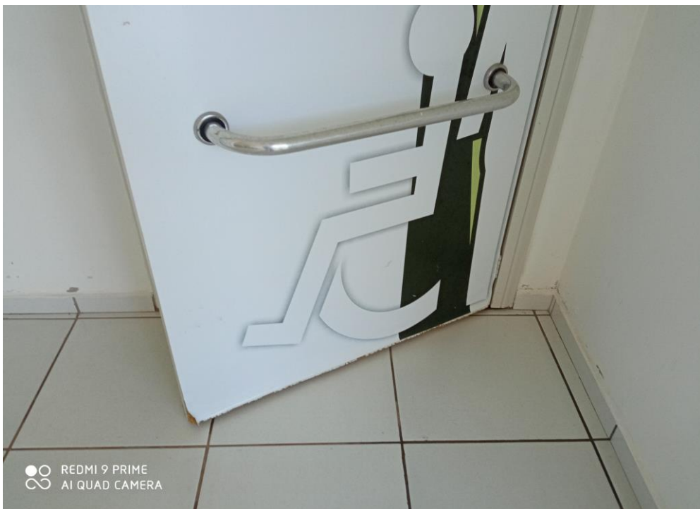
Figura 15 – substituição de portas;