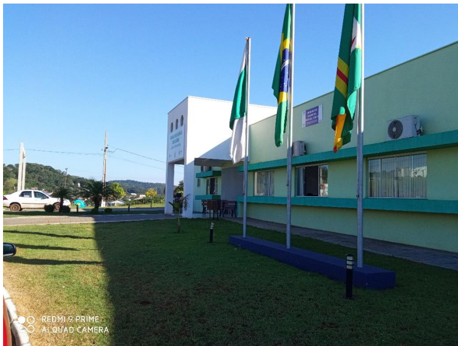
Figura 01 – Fachada da UBS;

O presente memorial fotográfico apresenta as condições da edificação onde serão realizados os serviços solicitados, complementando demais peças técnicas.