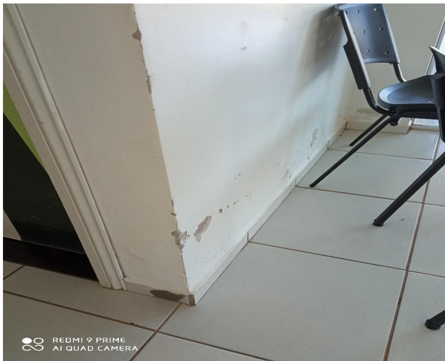
Figura 13 – Recuperação de parede;