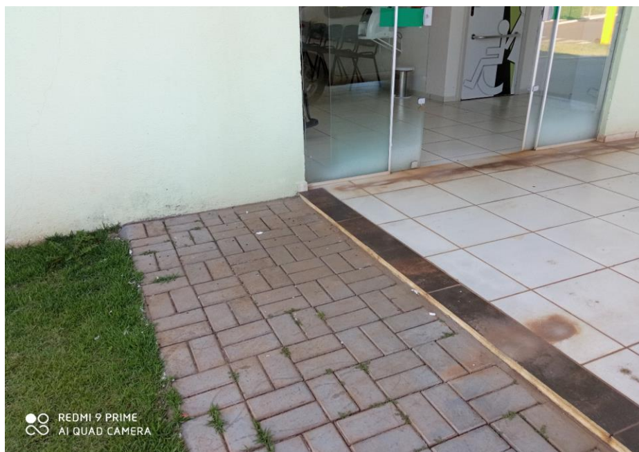
Figura 16 – substituição de pisos;

A reformar da estrutura física e da UBS proporcionará uma grande melhoria e conforto para as equipes médicas e odontológicas, funcionários e principalmente aos pacientes.