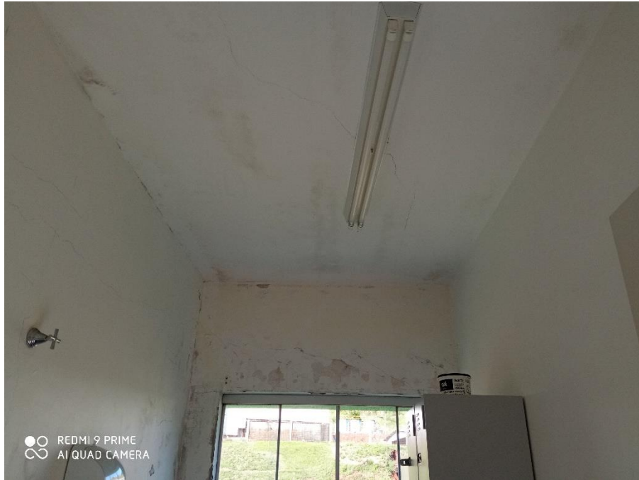
Figura 10 – Recuperação de laje e paredes;