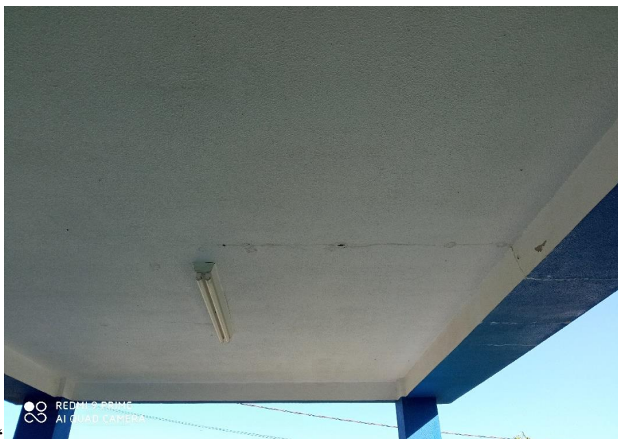
Figura 06 – Recuperação da laje (infiltração de água pluvial);