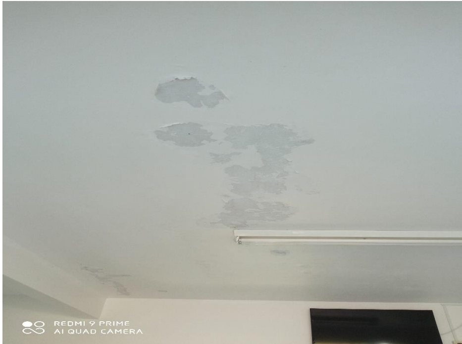
Figura 12 – recuperação de laje;