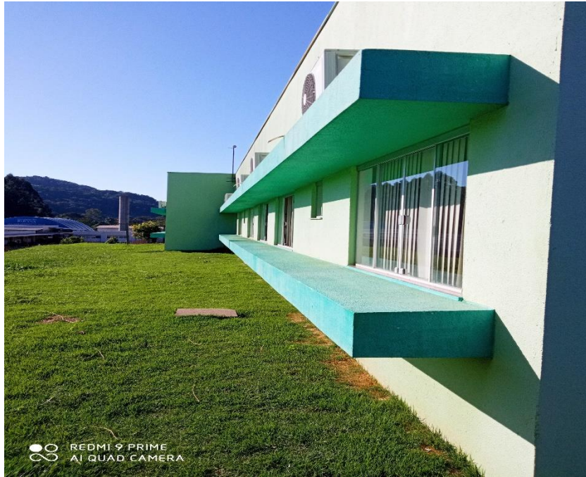
Figura 04 – Pintura externa;