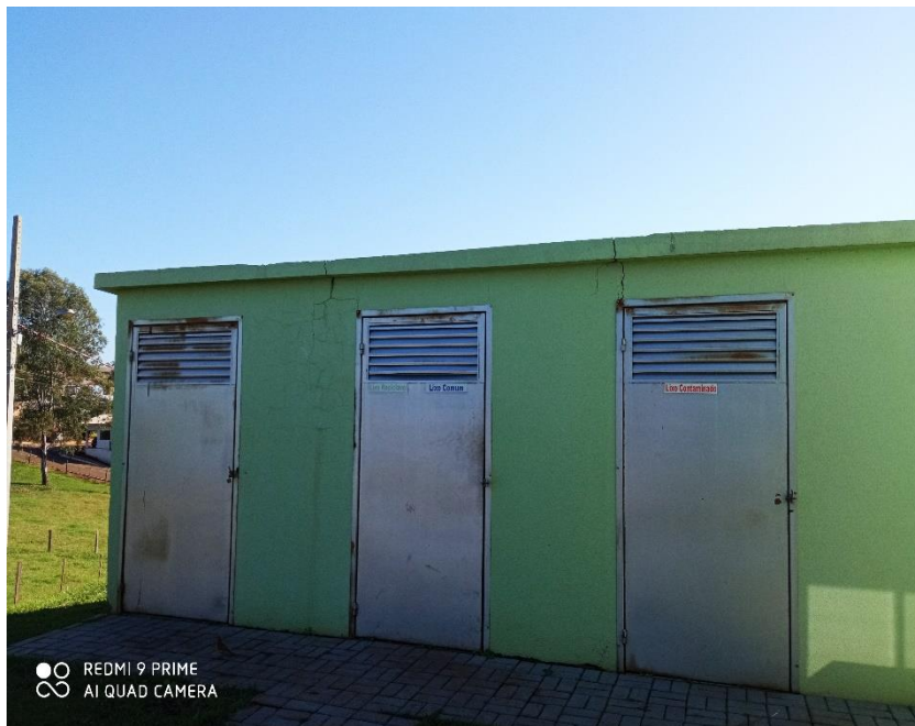
Figura 05 – Pintura externa e portas deposito de lixo;