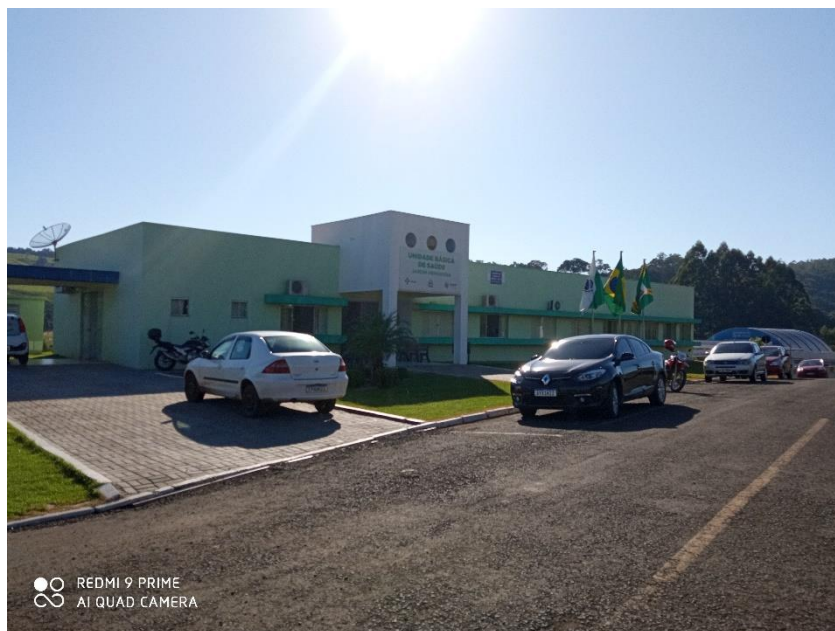
Figura 03 – Fachada da UBS;